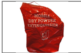
VERRIJDBARE BLUSTOESTELLEN BESCHERMHOEZEN