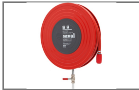
DECO-D RVS ROOD