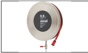
DECO-D RVS BLANCO