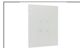
ACHTERWAND VOOR COMBINATIEKAST