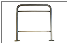
TYPE K COMBINATIEKAST CONSOLE